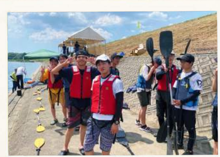
カヌー教室サポーター

パトランを通じて自分たちの力で、地域貢献活動ができることを知った私たちは、さらに地域活動を広げました。