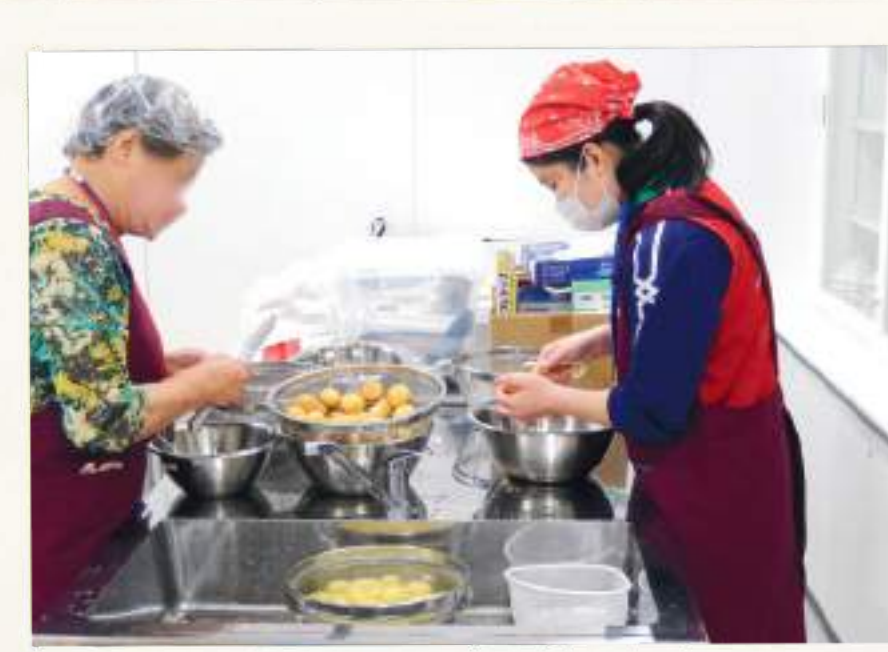
子ども食堂 カレー作り