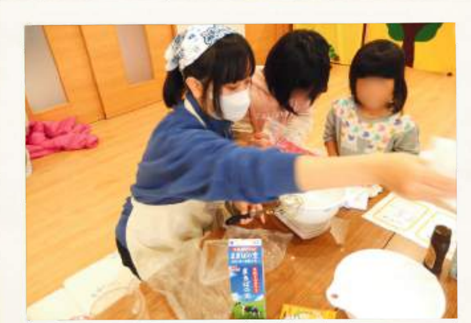
子ども食堂 調理体験