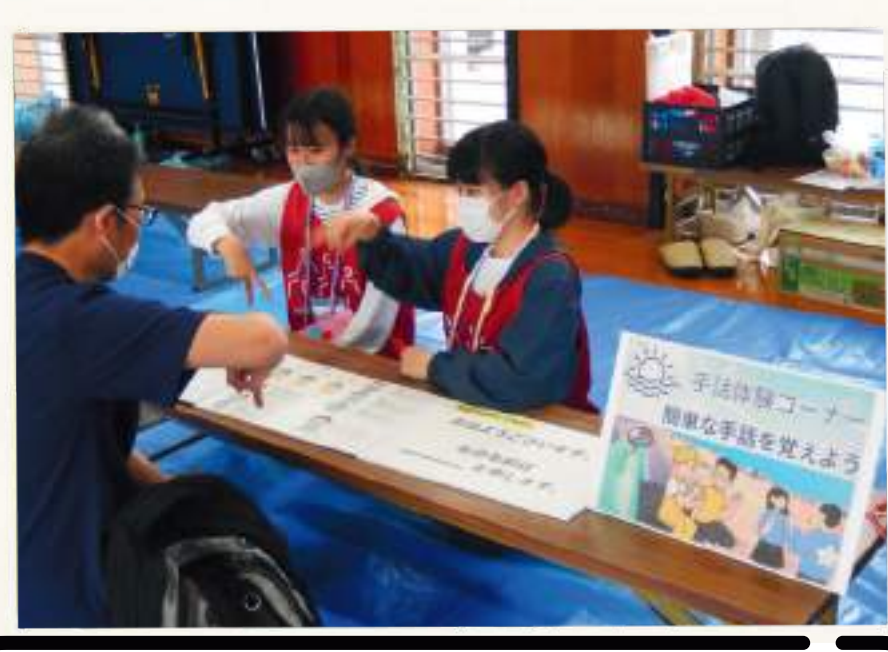
手話体験コーナー