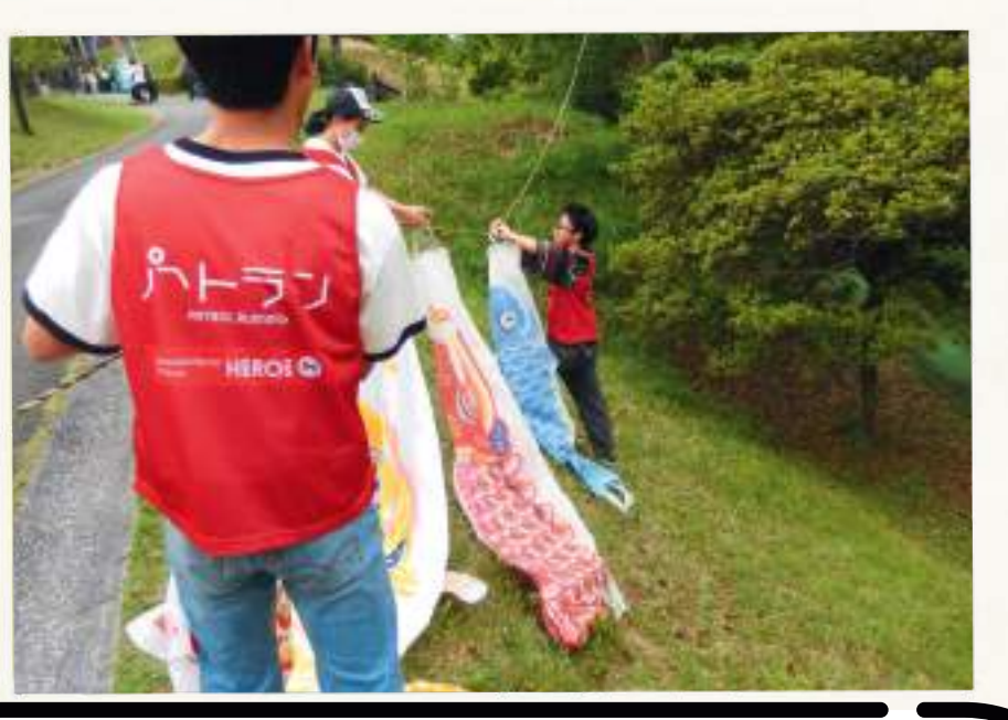
地域お祭りスタッフ