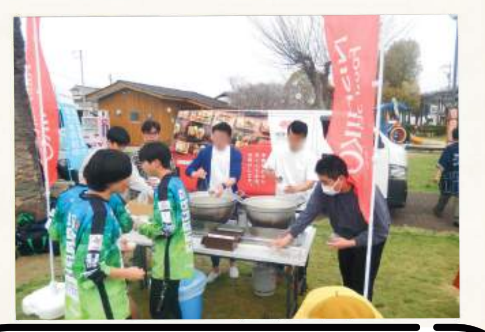
地元応援企業との連携