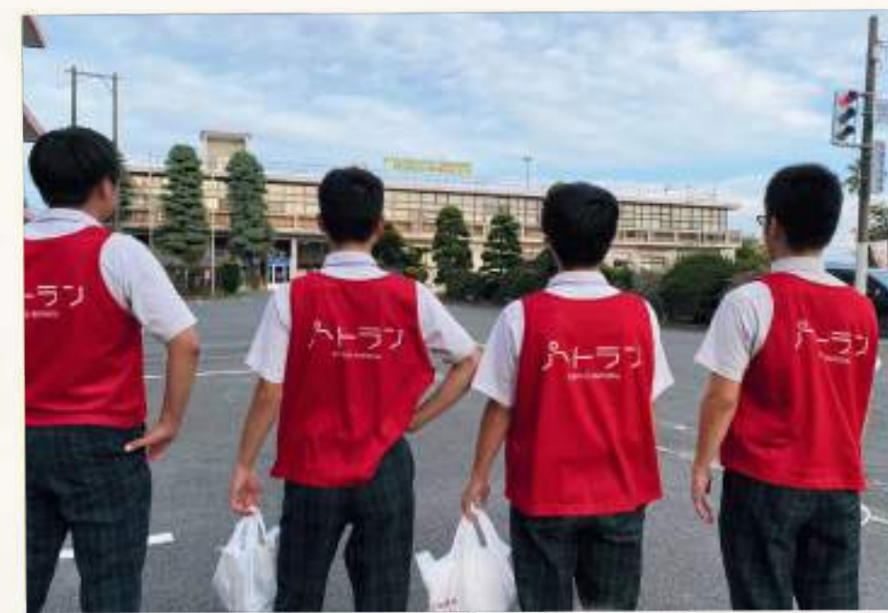
小学校周辺や駅がきれいに