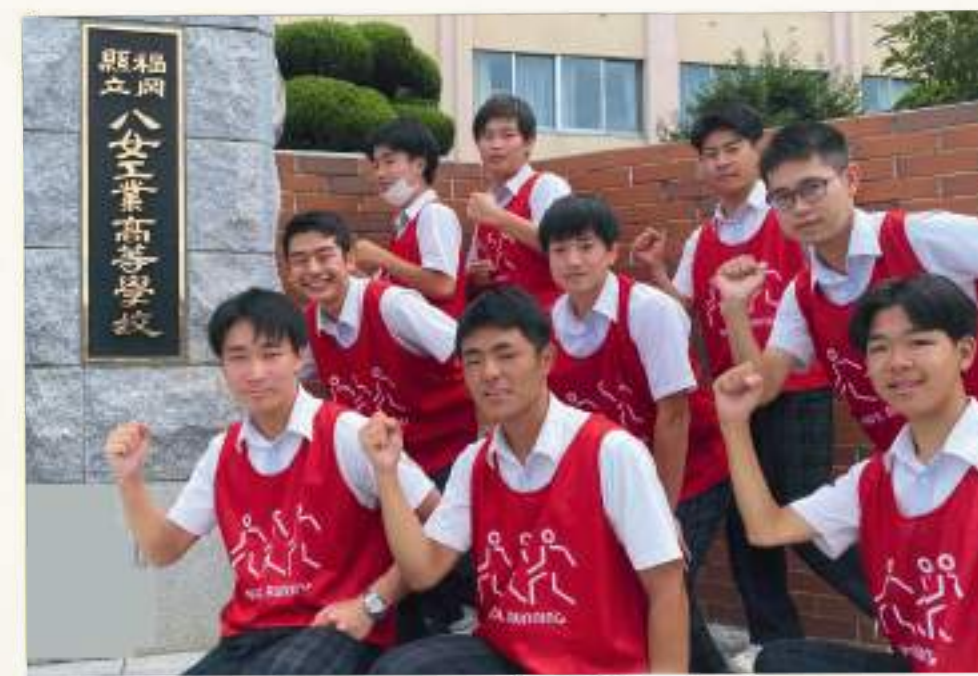
台風後の地域清掃