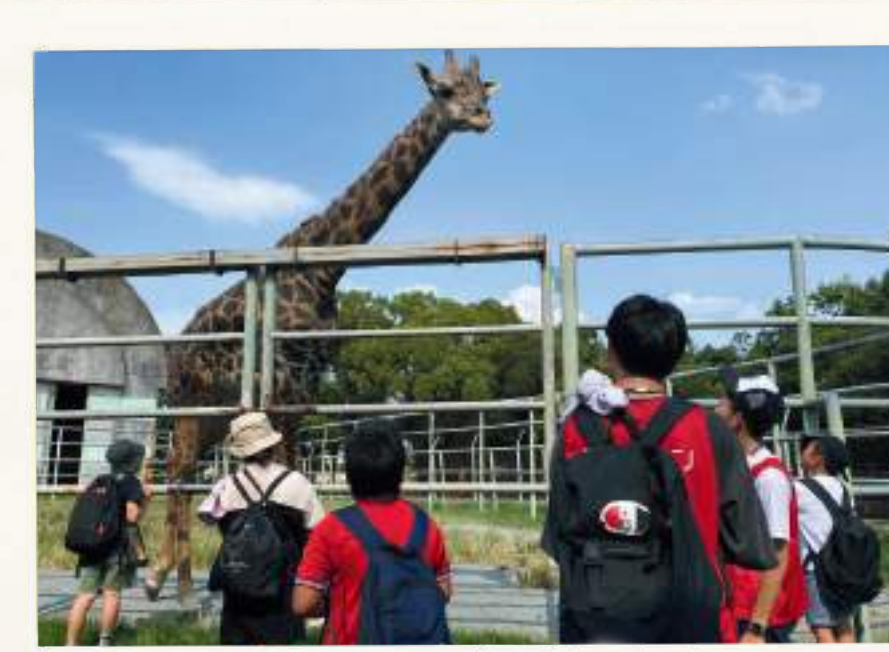
動物園引率サポーター