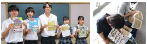
新聞社による取材活動 謎解きを楽しむ親子連れ

宇部市を代表する文化遺産「彫刻」と「リアル謎解きゲーム」を融合させたボランティアイベントは、2022年7月23日から約1か月間で563人の来場者を記録しました！