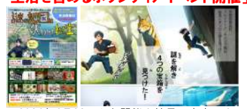
2024年4月22日から開催！結果は東京で！