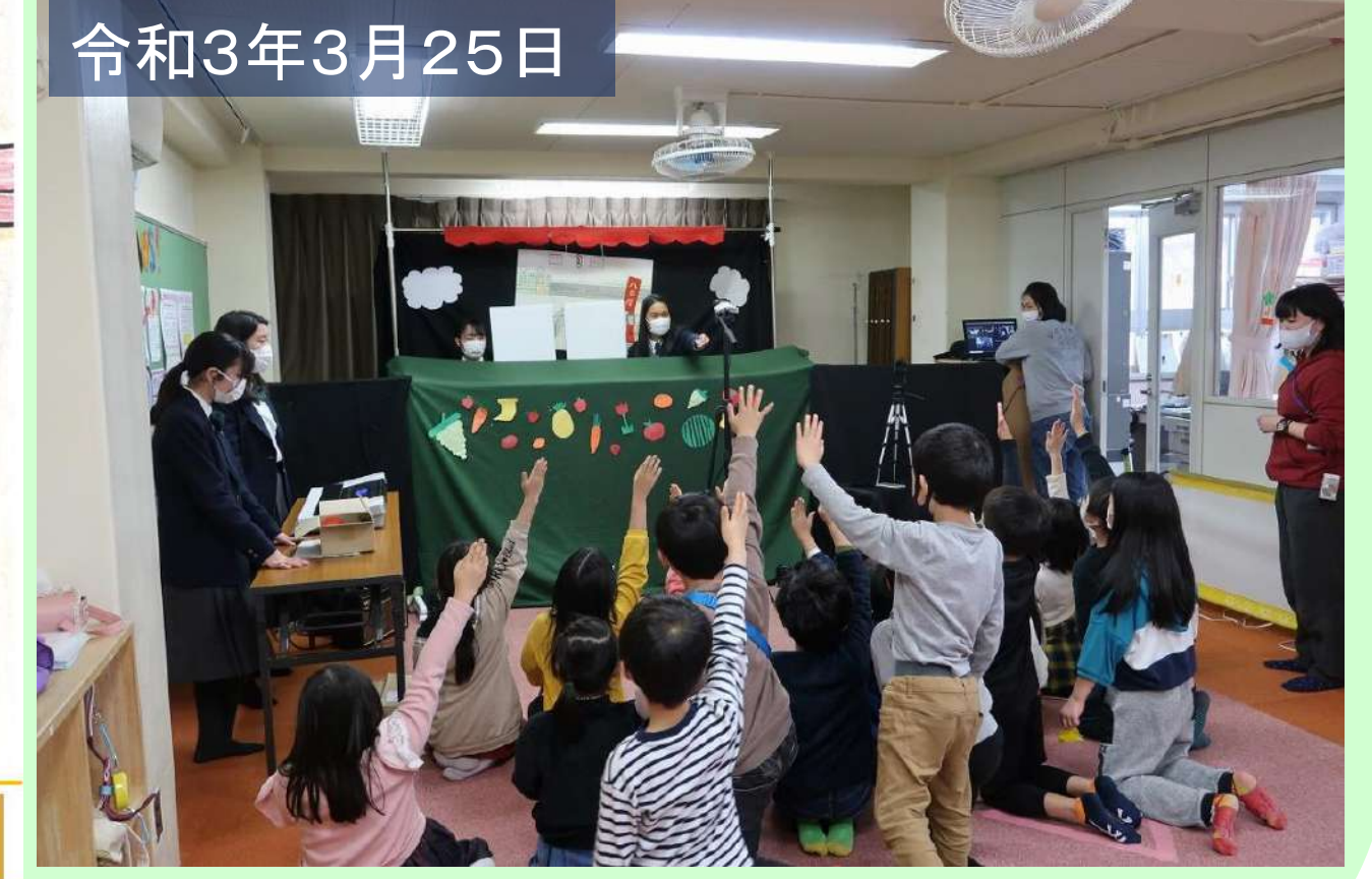
神戸市立愛垂児童館で公演