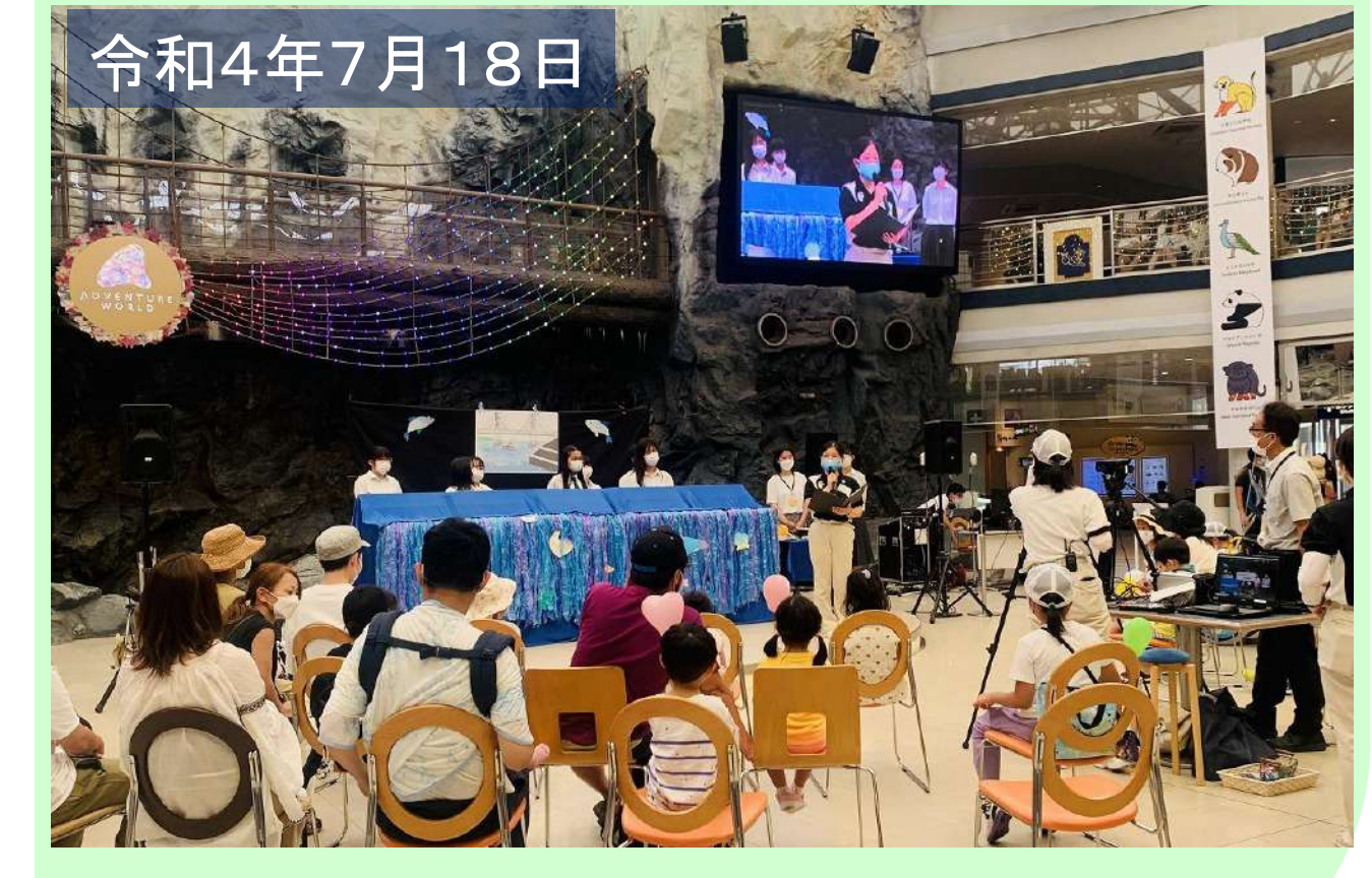
アドベンチャーワールドで公演