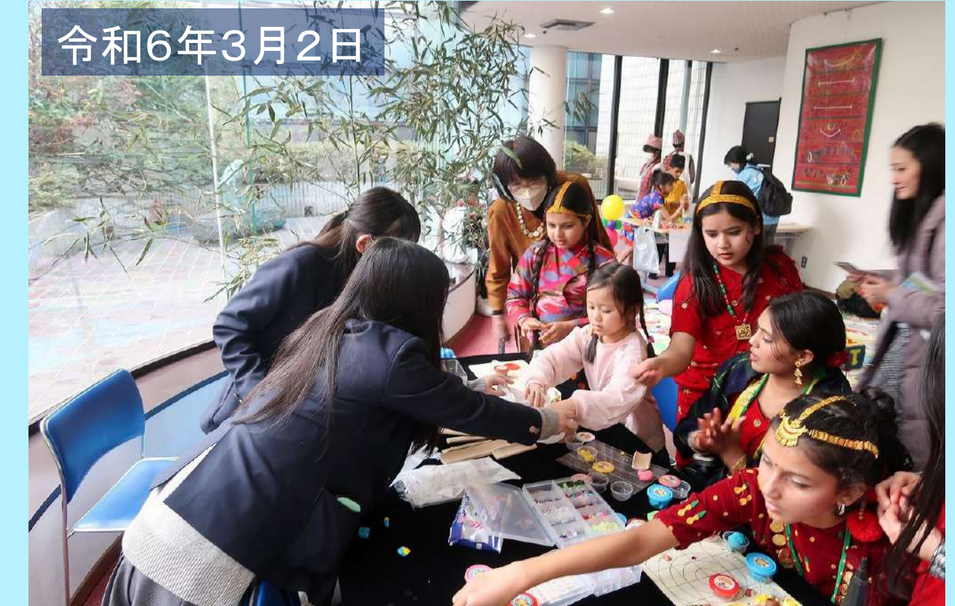
ユニセフのつどい2024