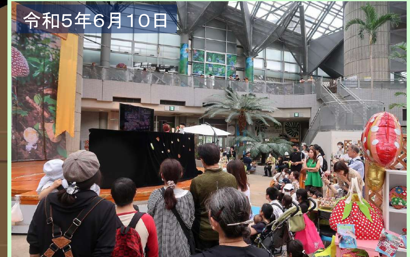
大阪 咲くやこの花館で公演