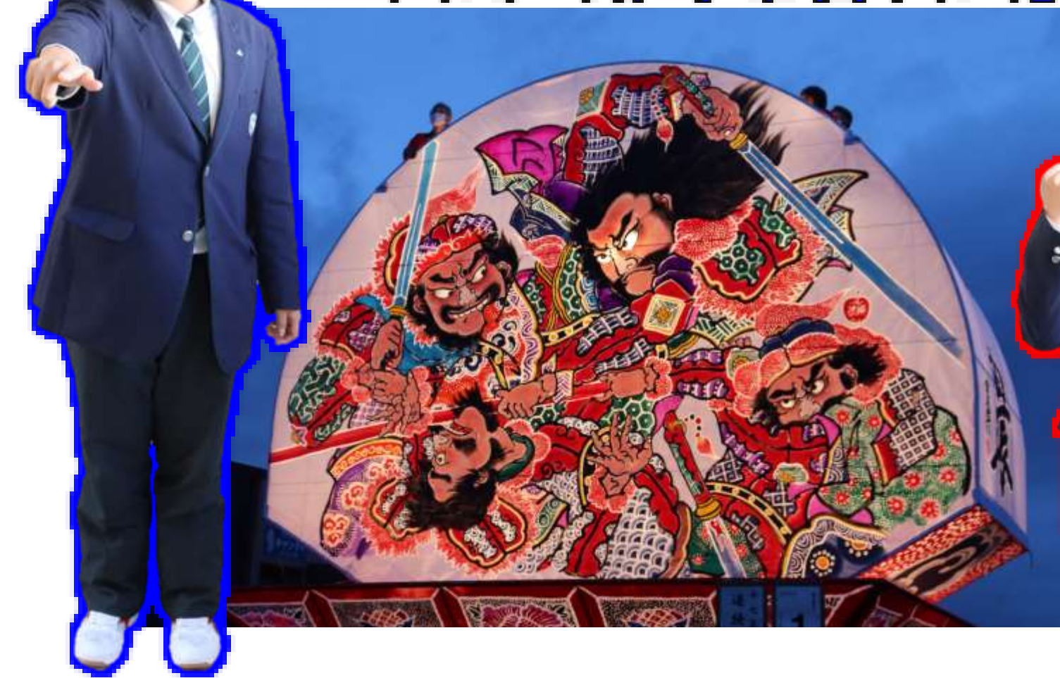
「三国志 諸葛瞻奮戦図」