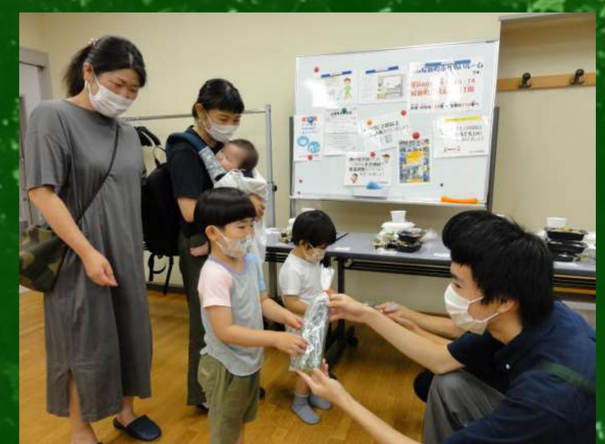
地域の親子へ配布