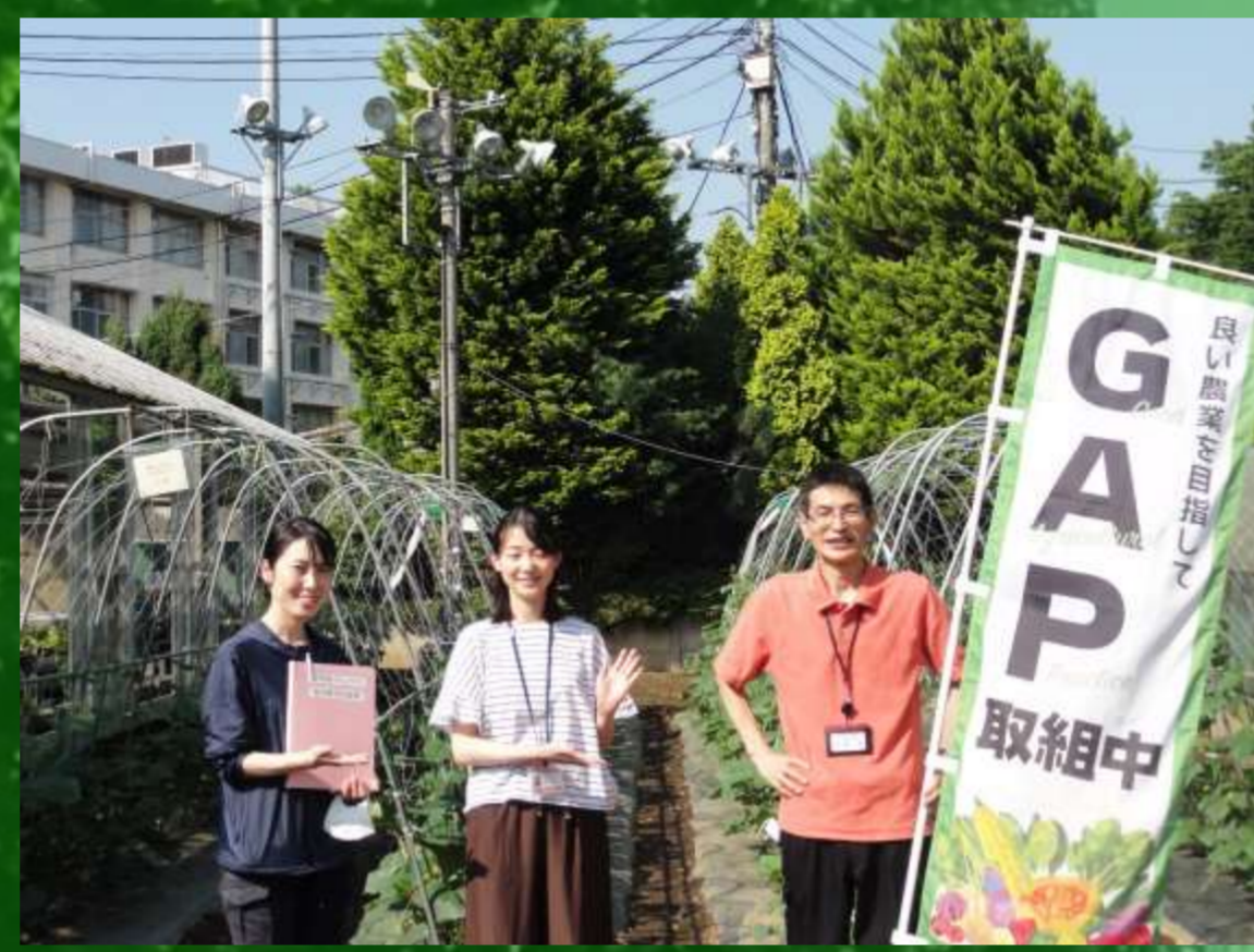
区社会福祉協議会来校