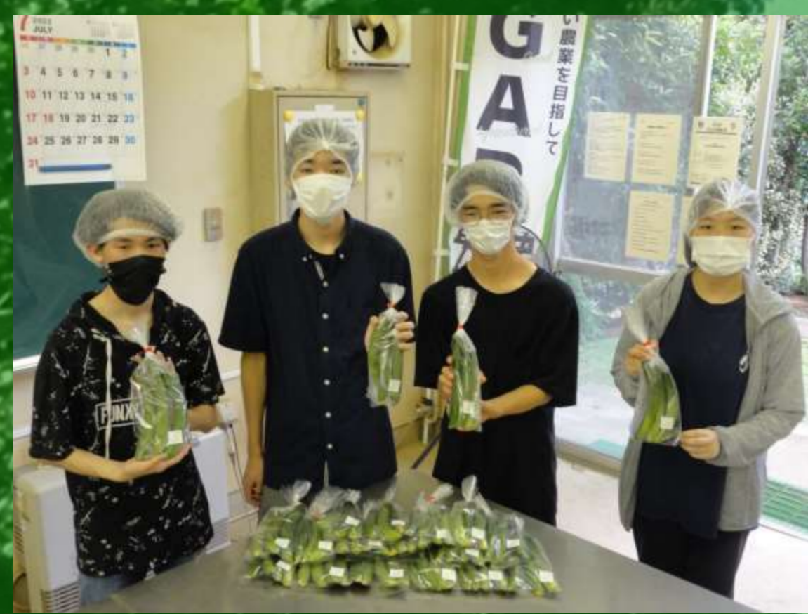
配布提供用キュウリ