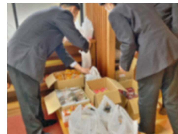
・地元テレビ ・読売新聞オンライン で紹介されました！