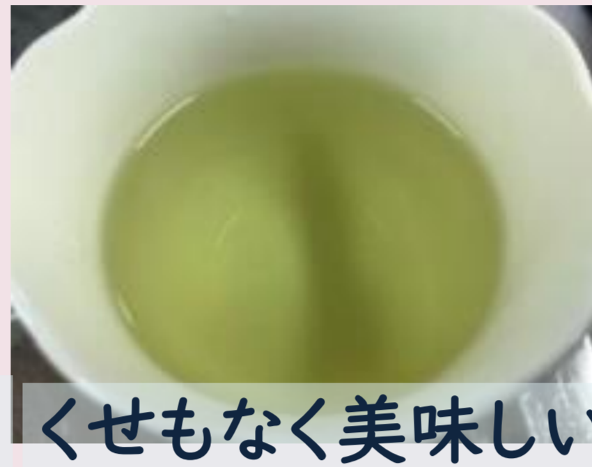
くせもなく美味しい