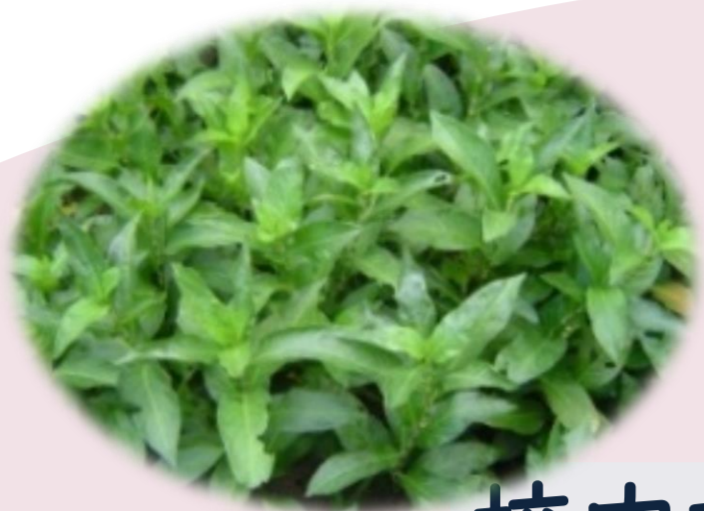
校内で栽培している藍の葉