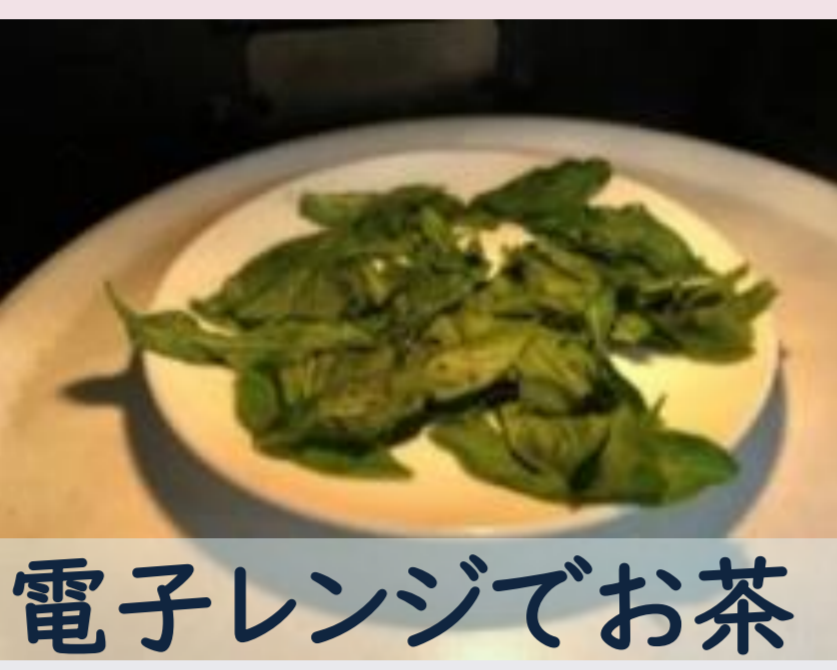
電子レンジでお茶