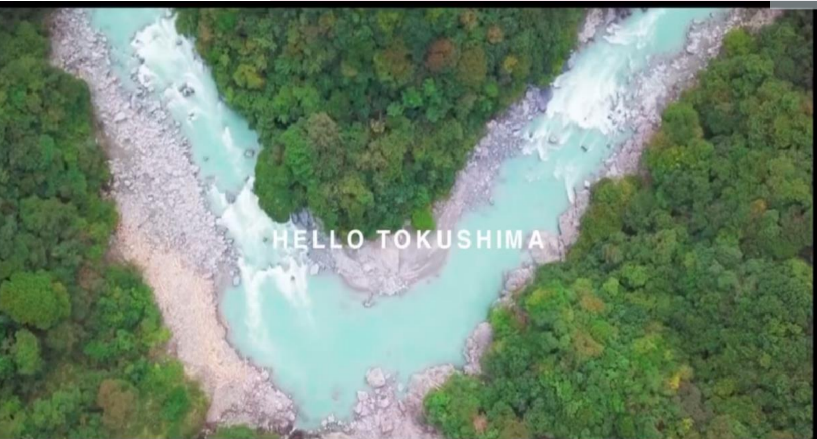
藍のPR動画をスマホで作成しました