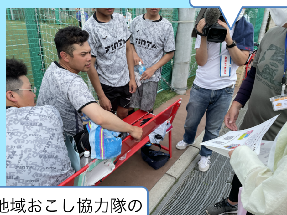
地域おこし協力隊のハンガリーの方にインタビュー