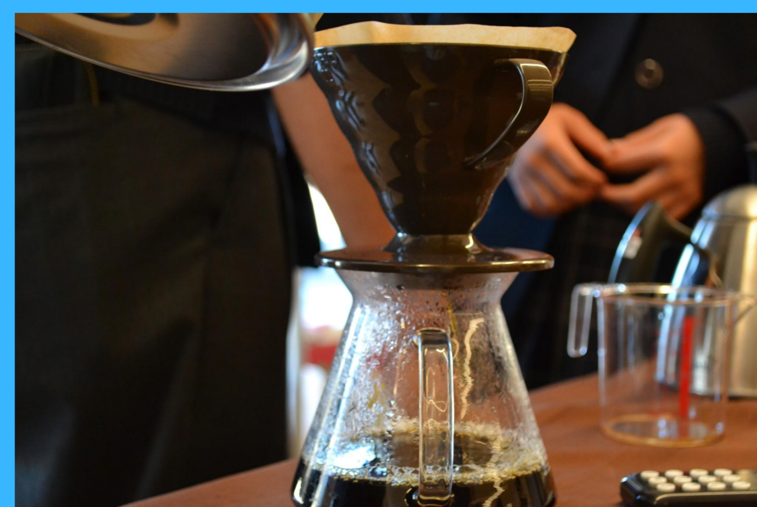
1杯1杯メンバーがコーヒーをハンドドリップで淹れています。