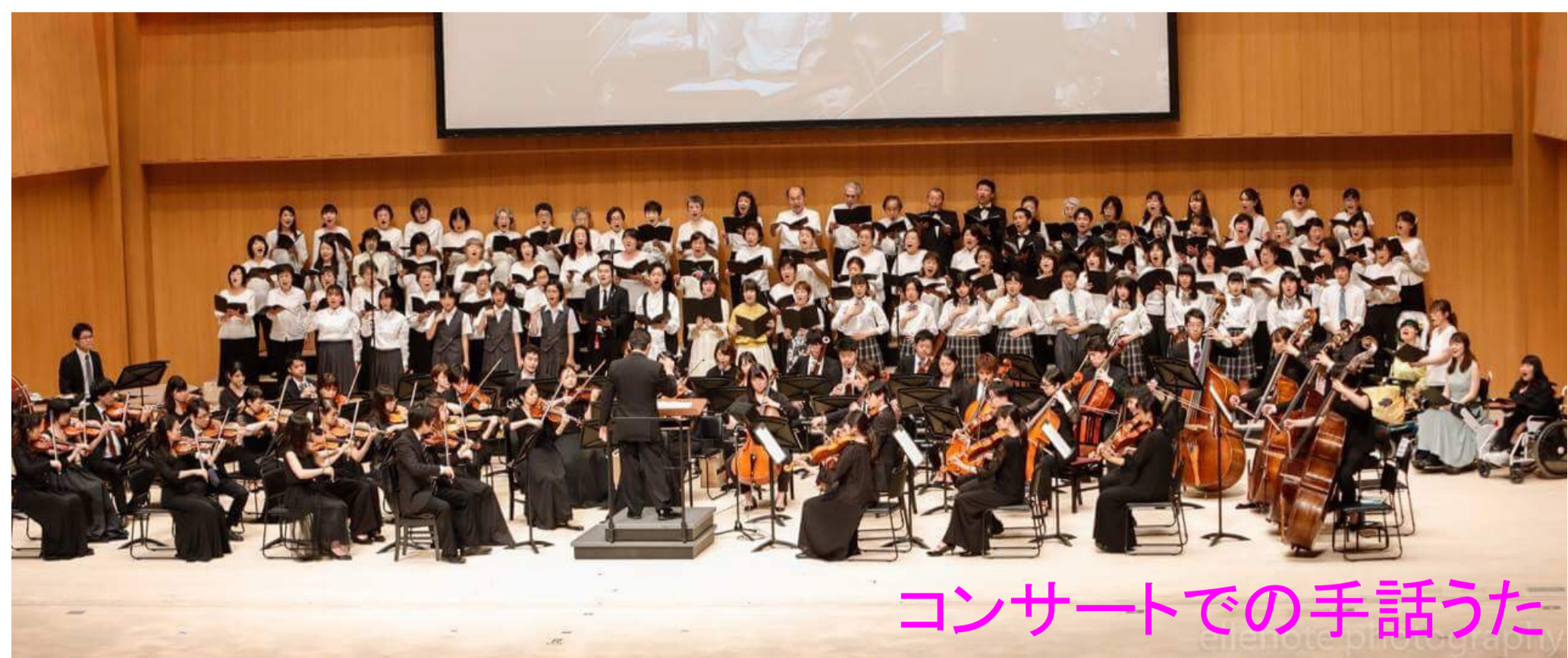
コンサートでの手話うた