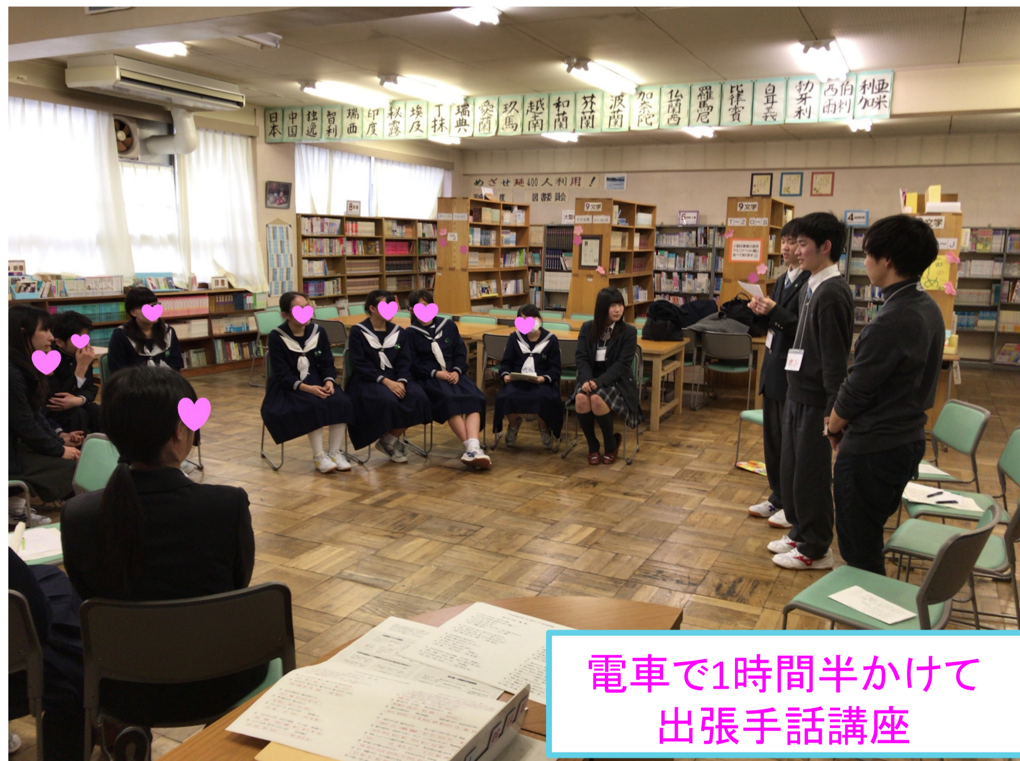
電車で1時間半かけて出張手話講座