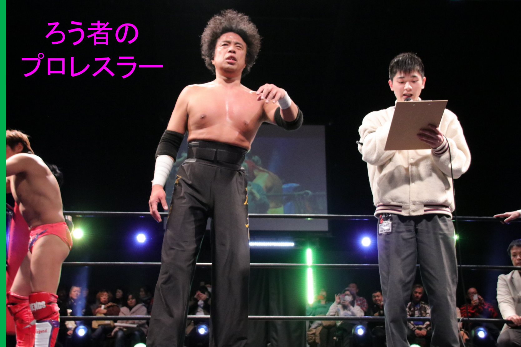
ろう者のプロレスラー