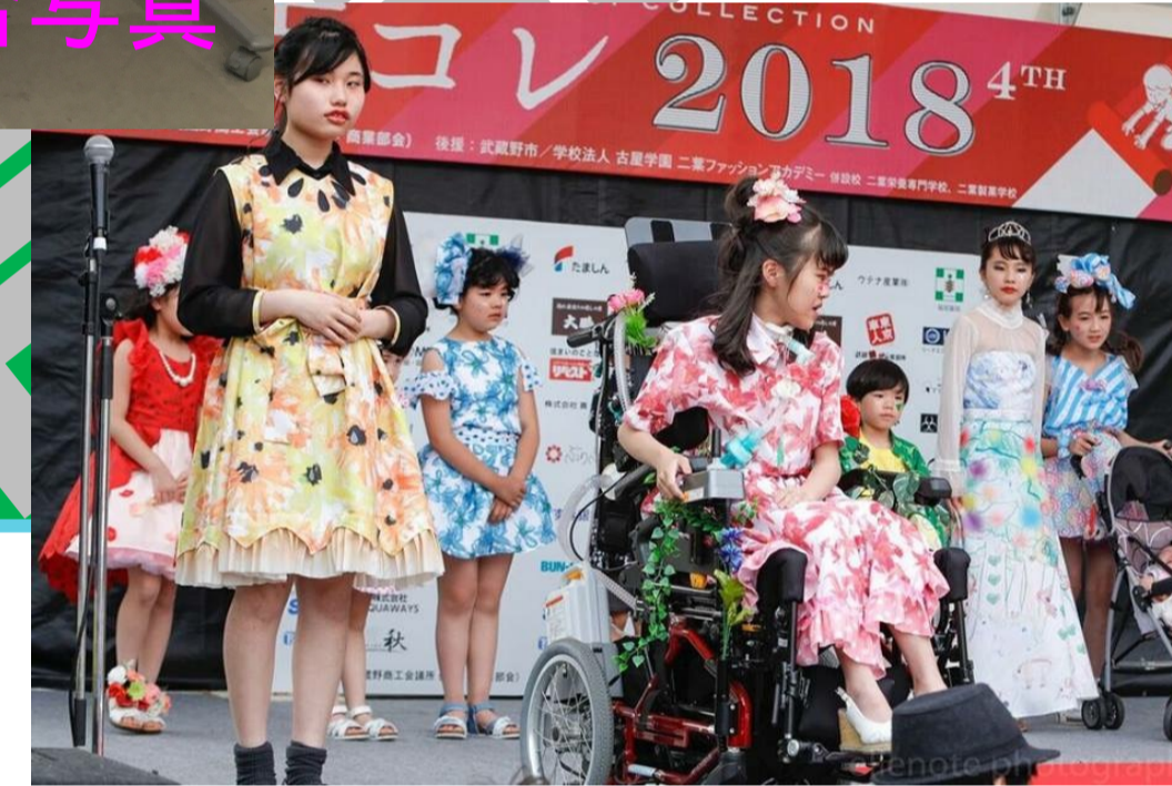
東京コレクションデザイナーさんと