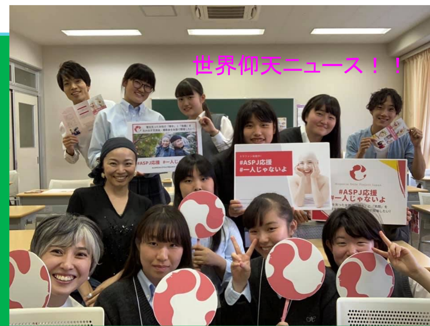
世界仰天ニュース！！